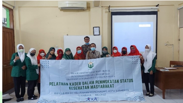
Gambar. 1 (c) Penutupan Kegiatan Pelatihan Kader

pada gambar b adalah dokumentasi pelaksanaan pelatihan mandiri salah satu kader dalam pemeriksaan kesehatan.