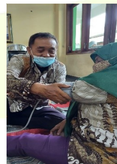
Gambar. 1 (a) Demonstrasi tindakan; (b) Pelatihan