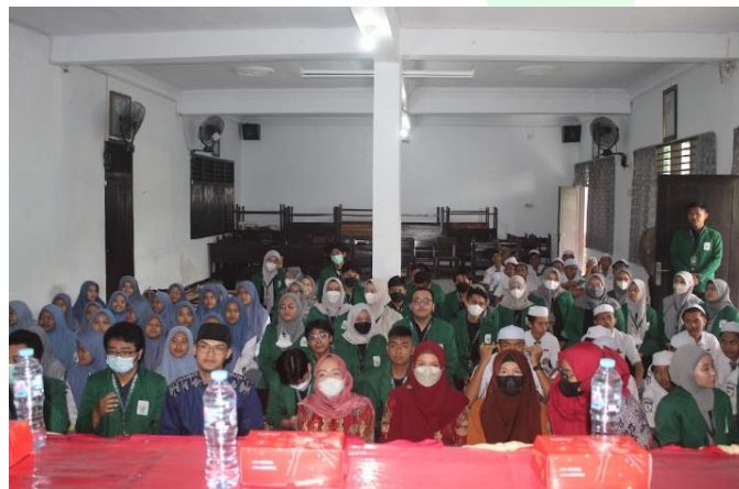
Gambar 1. Penyuluhan tentang Pengelolaan Sampah Plastik di PP. Zainul Hasan Genggong Probolinggo