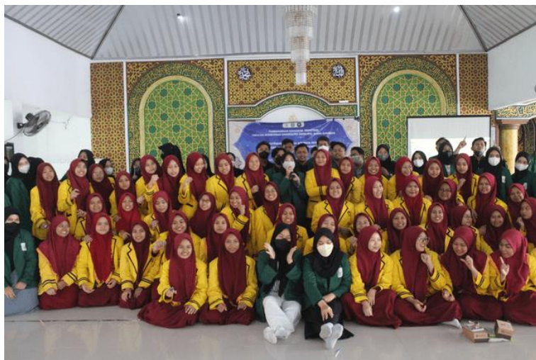
Gambar 1. Penyuluhan tentang Upaya Pencegahan DM Tipe 2 dengan Edukasi Asupan Gizi Seimbang di PP Wahid Hasyim Bangil