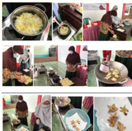
Gambar. 8 demonstrasi pembuatan keripik belimbing

Melakukan kegiatan demonstrasi tentang cara membuat keripik belimbing yang diikuti oleh seluruh peserta kader Desa Rowosari yang terbagi dalam 2 kelompok kecil. Masing-masing kelompok melakukan demonstrasi cara membuat keripik yang berasal dari belimbing yang matang dan berwarna kuning. Demonstrasi kegiatan tersebut diselenggarakan oleh tim dan bekerjasama dengan mitra yaitu para kader Desa Rowosari yang bertempat di balai desa. Kegiatan tersebut berlangsung sekitar 1 jam. Para kelompok peserta mempersiapkan barang-barang dan alat-alat untuk memasak.