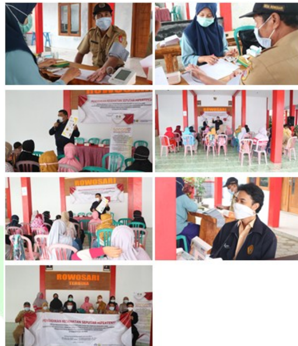
Gambar. 6 pendidikan kesehatan dengan tema hipertensi

Kemudian dilanjutkan dengan penyuluhan dengan tema membuat inovasi terhadap buah belimbing menjadi keripik belimbing untuk menurunkan tekanan darah. Pendidikan kesehatan ini diikuti oleh seluruh peserta kader Desa Rowosari yang diselenggarakan oleh tim dan bertempat di balai Desa Rowosari. Kegiatan penyuluhan ini ditekankan pada peran serta aktif kelompok masyarakat Desa Rpwpsari dalam membuat inovasi buah belimbing menjadi keripik belimbing yang dapat dikonsumsi untuk menurunkan tekanan darah tinggi. Selain itu juga para kader di berikan pelatihan dan demonstrasi mengenai cara membuat keripik belimbing yang didapat di Desa Rowosari sebagai bahan sumber daya yang dapat diolah menjadi bahan yang produktif. Kelompok masyarakat Desa Rowosari juga diajari cara manajemen hasil produksi keripik belimbing tersebut untuk dipasarkan di berbagai toko sembako di daerah Desa Rowosari.