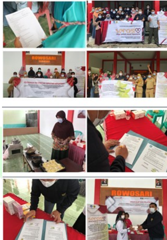
Gambar. 9 peserta kader desa mengisi post test dan pelaksanaan MoU antara Fakultas Keperawatan Unej dengan Kepala Desa Rowosari.