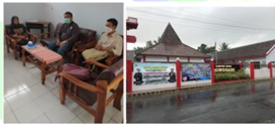
Gambar. 2 FGD tim pengusul dengan Mitra pada kunjungan

Melakukan kegiatan focus group discussion tahap ke-1 oleh tim Program Pengabdian Desa Binaan dengan pihak Mitra yaitu Kepala Desa Rowosari mengenai rencana kegiatan program pengabdian desa binaan yang akan dilaksanakan di Desa Rowosari meliputi: 1) berkoordinasi, membuat kontrak kegiatan dan membina hubungan agar dapat bersinergi dalam pelaksanaan kegiatan; 2) menjelaskan tujuan diadakannya kegiatan program pengabdian desa binaan; 3) menjelaskan isi program-program kegiatan dalam pengabdian desa binaan.