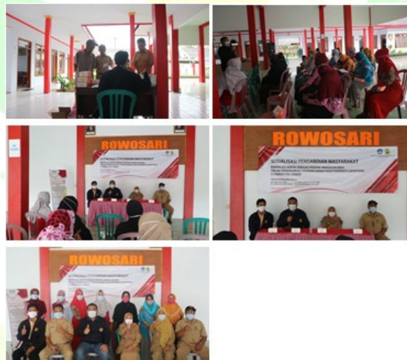
Gambar. 4 sosialisasi pembentukan kelompok sosial peduli hipertensi di Desa Rowosari

memberdayakan masyarakat perempuan terutama yang tidak memiliki pekerjaan atau sebagai ibu rumah tangga. Sehingga diharapkan dapat meningkatkan keterampilan dalam pengelolaan belimbing dalam menurunkan tekanan darah pada penderita hipertensi pada masyarakat Desa Rowosari. Tujuan akhir kegiatan ini yaitu diharapkan dapat menciptakan lapangan pekerjaan bagi masyarakat Desa Rowosari dan dapat meningkatkan pendapatan ekonomi keluarga. Selain itu juga dapat menghasilkan produk keripik belimbing yang dapat bermanfaat dari segi kesehatan yaitu menurunkan tekanan darah terutama pada penderita hipertensi.