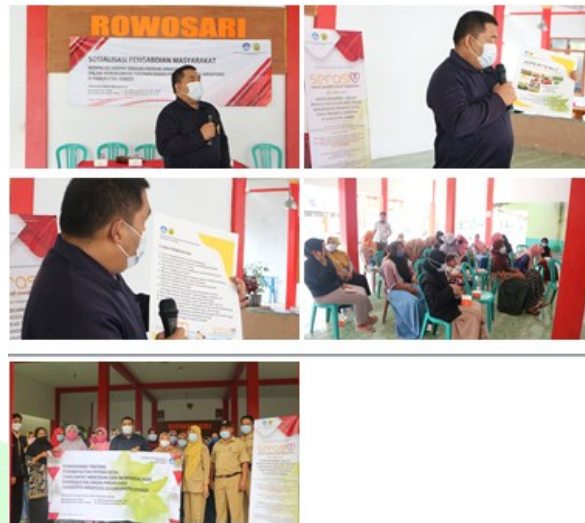
Gambar. 7 pendidikan kesehatan tentang pemanfaatan buah belimbing sebagai potensi desa yang dapat mencegah dan mengendalikan tekanan darah tinggi

Melakukan kegiatan demonstrasi tentang cara membuat keripik belimbing yang diikuti oleh seluruh peserta kader Desa Rowosari yang terbagi dalam 2 kelompok kecil. Masing-masing kelompok melakukan demonstrasi cara membuat keripik yang berasal dari belimbing yang matang dan berwarna kuning. Demonstrasi kegiatan tersebut diselenggarakan oleh tim dan bekerjasama dengan mitra yaitu para kader Desa Rowosari yang bertempat di balai desa. Kegiatan tersebut berlangsung sekitar 1 jam. Para kelompok peserta mempersiapkan barang-barang dan alat-alat untuk memasak.