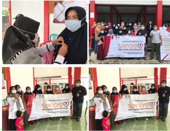
Gambar. 5 pembentukan kelompok sosial peduli hipertensi di Desa Rowosari

Melakukan kegiatan ceramah/penyuluhan oleh tim melalui metode diskusi secara langsung dengan para kader Desa Rowosari dengan menjelaskan secara detail mengenai hipertensi. Kegiatan penyuluhan ini dilaksanakan di balai Desa Rowosari yang diikuti oleh semua peserta. Kegiatan ini didahului dengan pemeriksaan tekanan darah, gula darah, dan kolesterol pada peserta kader Desa Rowosari. Setelah melakukan pemeriksaan tersebut dilanjutkan dengan kegiatan pendidikan kesehatan. Tema yang disampaikan meliputi pengertian hipertensi, factor-faktor yang dapat menyebabkan hipertensi, tanda dan gejala terjadinya hipertensi, cara penanganan dan perawatan hipertensi.