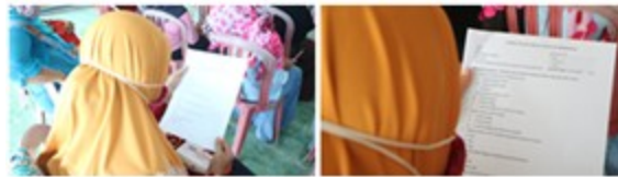
Gambar. 3 peserta kader desa mengisi kuesioner pre-tes

Kegiatan diawali dengan melakukan pre-tes yaitu dengan mengisi kuesioner hari pertama sebelum kegiatan dimulai yang diikuti oleh seluruh peserta kelompok masyarakat Desa Rowosari. Peserta kelompok masyarakat Desa Rowosari mengisi kuesioner dengan seksama dan antusias yang sudah disiapkan oleh tim. Jumlah peserta yang mengisi kuesioner pre-tes ini sebanyak 40 orang yang terdiri dari petugas kader desa.