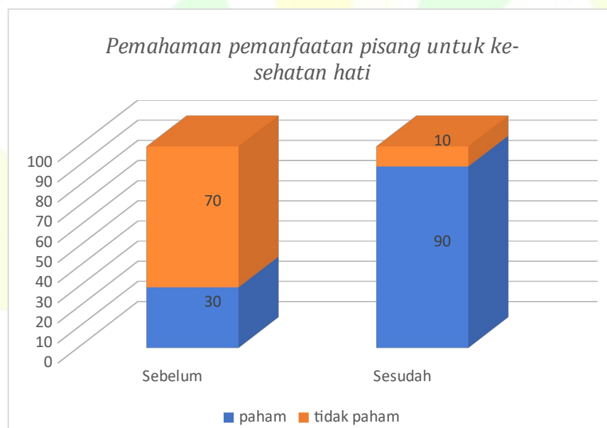
Gambar .1 Pemahaman pemanfaatan pisang

Berdasarkan hasil tingkat pemahaman didapatkan hasil bahwa sebelum dilakukan sosialisasi dilakukan pengukuran pemahaman pada masyarakat untuk pengukuran pemahaman pisang sebagai manfaat untuk kesehatan hati didapatkan bahwa pada sebelum didapatkan 70% masyarakat tidak paham tentang manfaat pisang sebagai Kesehatan hati dan 30% masyarakat paham terhadap masyarakat, selanjutnya setelah sosialisasi dilakukan didapatkan bahwa terjadi peningkatan yang signifikan sebesar 60% yaitu dari 30% ke 90% berdasarkan tingkat pemahaman.