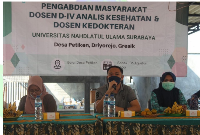
Gambar. 3 Sosialisasi Manfaat pisang

Sosialisasi dilakukan pada masyarakat Desa Petiken didapatkan manfaat yang dengan menambah pengetahuan dengan meningkatnya pengetahuan masyarakat tentang pentingnya konsumsi buah pisang yang kaya akan manfaat yang tinggi untuk meningkatkan derajat Kesehatan masyarakat